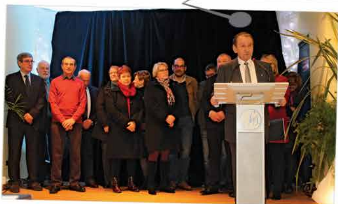
La cérémonie des vœux aux Sagiens organisée le 13 janvier a permis de se remémorer les moments forts de 2016 et d'annoncer les perspectives 2017, en particulier la fin des travaux de réhabilitation des Halles et la réouverture de la Médiathèque en ce lieu en septembre.