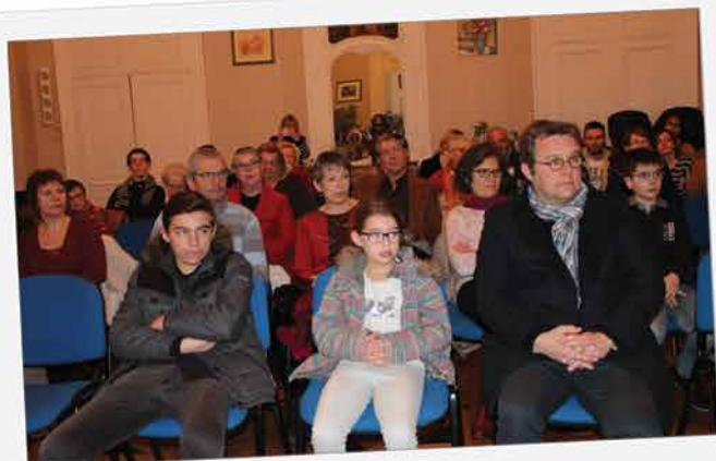
Vendredi 27 janvier, les nouveaux habitants de Sées (arrivés au cours de 2016) étaient conviés à une soirée de présentation de la ville : infrastructures, commerces, services, patrimoine, manifestations... Un moment instructif et convivial qui fut apprécié de tous.