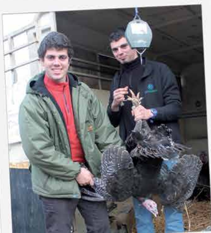
Belle édition de la Foire aux dindes et des différentes animations, mi-décembre. Nouveau record de participation pour les 10 km de Sées : 817 personnes se sont au final classées ! Jusqu'où iront-ils ?!