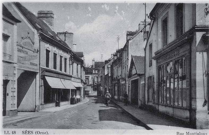
LL 48 SÉES (Orne).