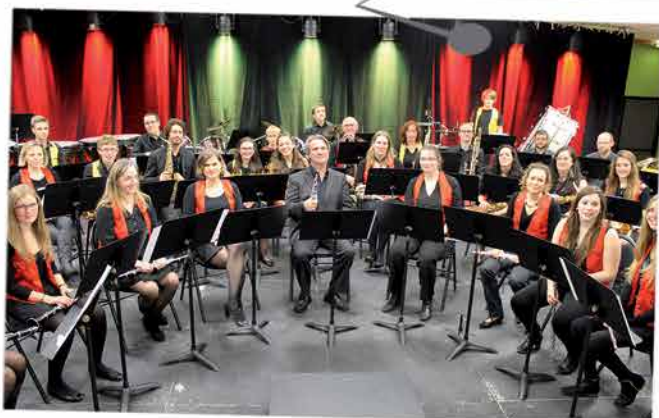
160 personnes se sont rendues au concert de l'Alliance musicale et des élèves de l'école de musique, fin novembre. Consacrée au thème espagnol, la soirée - en ouverture du festival Vamos al cine ! - fut rythmée et, l'ambiance « légère ».