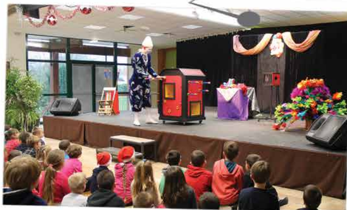
Pour clôturer l'année 2015, un spectacle de clowns a été présenté au centre polyvalent le 20 décembre. Les enfants et les parents étaient sous le charme des deux artistes, magnifiques avec leur costume et maquillage.