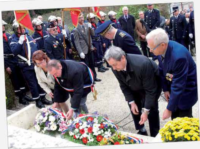
Moment de recueillement lors de la cérémonie du 11 novembre, commémorant l'Armistice 1918. Comme l'an passé, le Souvenir français de Sées a profité de ce rassemblement pour présenter son exposition annuelle.