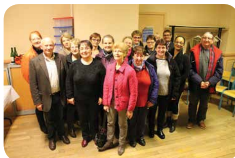
Pot de remerciements aux bénévoles de l'année 2015