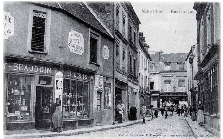
SÉES (Orne) - Rue Levêque