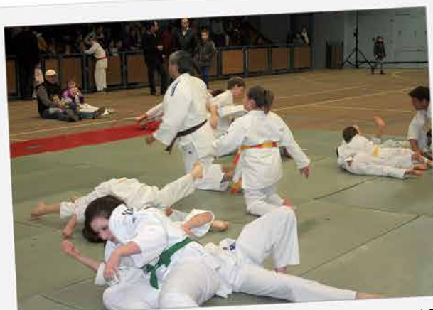
Beau succès pour l'opération Téléthon sur Sées et les alentours : 4 471.50 € ont été au total collectés avec l'aide de l'Association familiale, Générations mouvement - les aînés ruraux, Macé pour tous et, les clubs sportifs sagiens lors de la soirée aux gymnases.