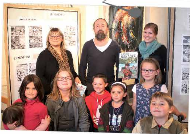
Le mois d'octobre fut consacré aux oeuvres de Sébastien Corbet. « Entre peinture et BD », tel était le nom de l'exposition de cet artiste local. Le public a donc pu découvrir une double exposition, permettant à la fois d'appréhender sa technique de créateur de BD mais aussi son sens artistique.