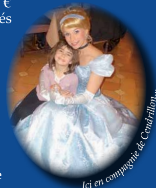
Ici en compagnie de Centriflori...

Pour suivre l'action de cette association, RDV sur http://1geste-1reves-1sourire.over-blog.com