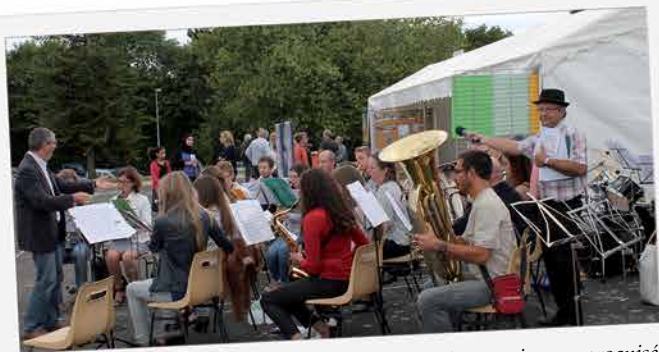
1 re édition remarquable pour le Forum des associations sagiennes, organisé début septembre dans les gymnases de la ville. Bon nombre d'associations ou clubs sportifs ont convaincu de nouveaux adhérents. Opération réussie !