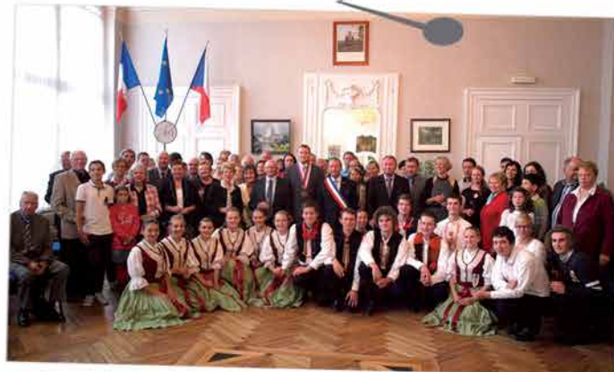
La jeunesse était au rendez-vous lors de la venue des tchèques, avec le jumelage Sées-Staré Mesto, mi-octobre. Le groupe a eu l'occasion de visiter la ville, ainsi que celles du Mans, Caen et Bayeux ... Prochain rendez-vous : 2017, pour le voyage des Français en République tchèque. Avis aux amateurs !