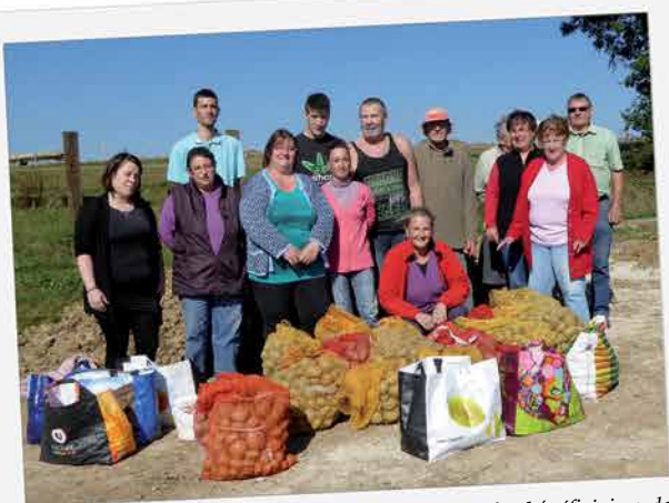
400 kg de pommes de terre ont été ramassés par des bénéficiaires de la Banque alimentaire, avec l'aide de bénévoles et de résidents du foyer Saint-Martin. Belle opération réalisée sous le soleil ornaï !