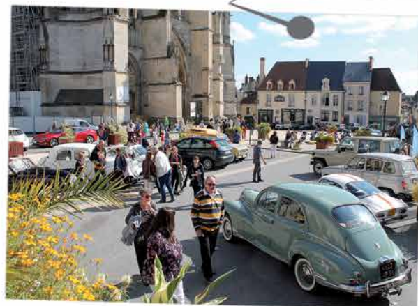
Le public était au rendez-vous pour découvrir les édifices remarquables de Sées, lors des Journées du Patrimoine 2015. Le Rotary club de Sées-Gacé a proposé une exposition de véhicule de collection, apportant ainsi un attrait supplémentaire à la journée du dimanche.