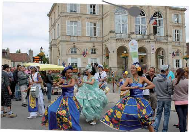
Ambiance brésilienne et foule présentes dans les rues, toute la journée, le 14 juillet. L'évènement s'est clôturé par un concert détonnant et un magnifique feu d'artifice au stade municipal !