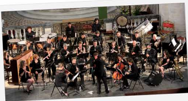
Le 09 juillet, l'Ensemble Orchestral de l'Orne, a fait vibrer la cathédrale de Sées et les coeurs présents, pour un premier concert mémorable.