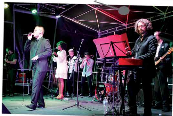
Le Soul Vintage Orchestra a enchanté le public lors du premier concert des Dimanches au bord de l'Orne, le 02 août. Deux voix remarquables, des standards de grandes musiques de la soul afro-américaine, rien de mieux pour démarrer l'édition 2015... Le public présent confirme l'importance de cet évènement, toujours incontournable !