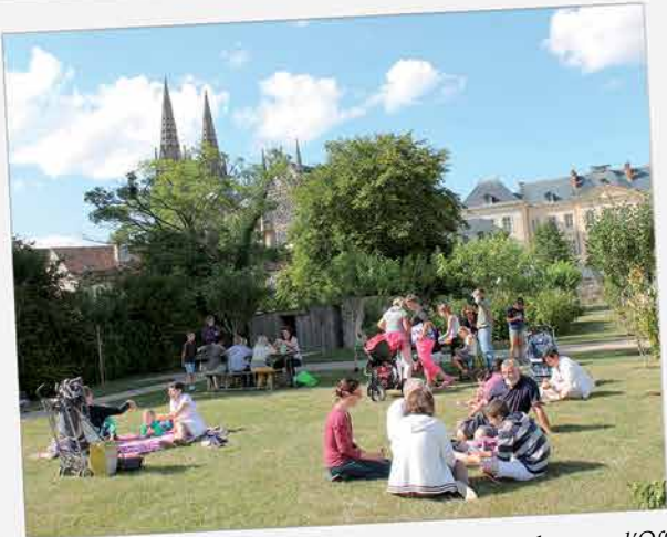
Les Jeudis d'Argentré, nouvelle animation mise en place par l'Office de tourisme a remporté un vif succès. Les habitués étaient de la partie chaque jeudi, pour les jeux d'eau et de société ou encore les ateliers de lecture et d'origami. Le final, avec le groupe The Beauty and the beast, a terminé cette animation en musique !