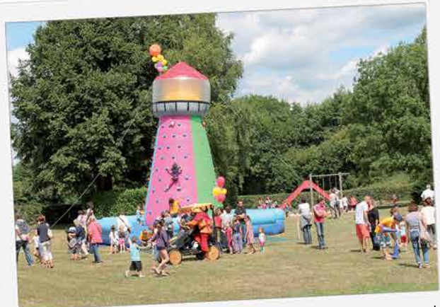
50 ans, cela se fête ! C'est pourquoi une grande journée était organisée le 25 juillet pour l'anniversaire du Centre de loisirs sagien. Jeux divers, théâtre, structures gonflables, cracheur de feu et concert, les Sagiens furent nombreux à profiter de cette animation...