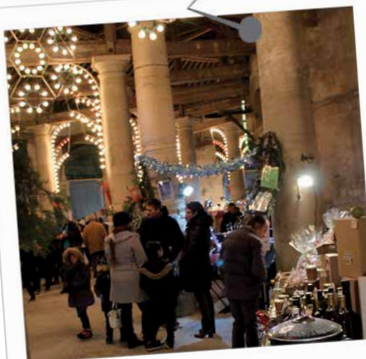
50 exposants venus de Basse-Normandie et des régions limitrophes étaient présents lors du Marché de Noël ; une trentaine lors de la Bourse aux jouets.