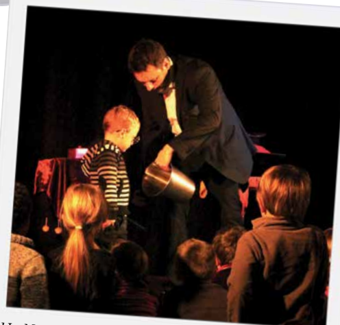
Un Noël des enfants réussi le dimanche 21 décembre : le public, d'enfants et de parents, était présent ; les tours de magie ont ravi tout un chacun, ainsi que la présence du Père Noël ; le goûter a clôturé cet après-midi festif.