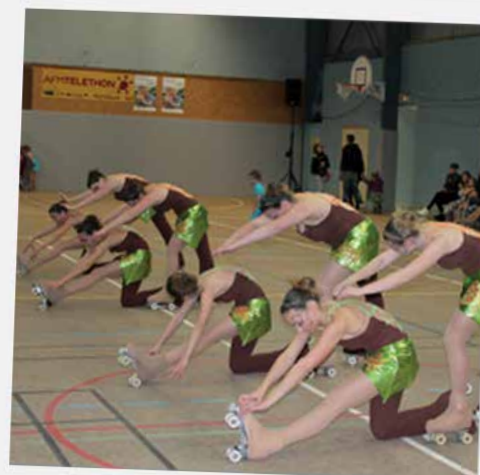
3525 € ont été collectés au profit du Téléthon lors des actions organisées par la Ville et les associations Génération mouvement - Aînés ruraux, Macé pour tous et l'Association familiale.