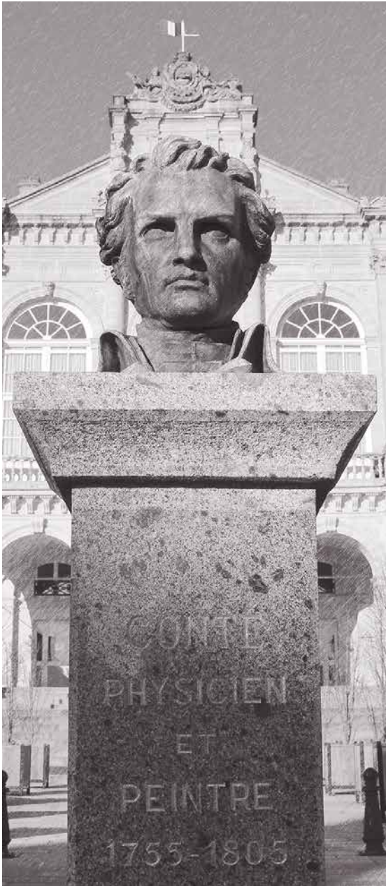
Buste placé devant l'Hôtel de Ville de Sées

Ingénieur, physicien, artiste, mécanicien, inventeur fécond et travailleur acharné, Nicolas-Jacques Conté a marqué son époque.