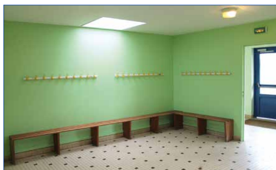
vestiaire central du gymnase