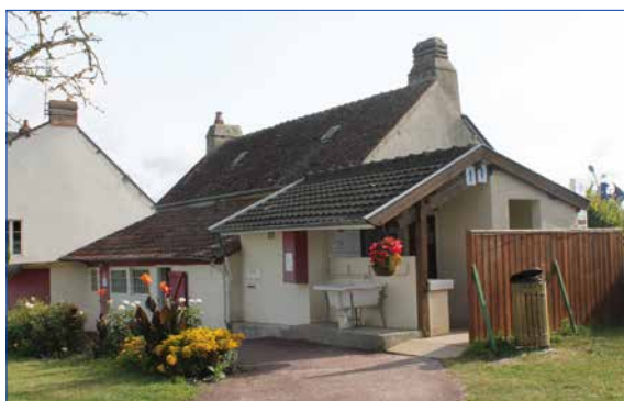
sanitaires du camping municipal Le Clos normand