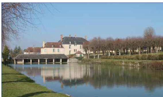
lavoir du Cours des Fontaines