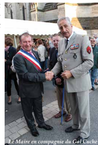
Le Maire en compagnie du Gal Cuche