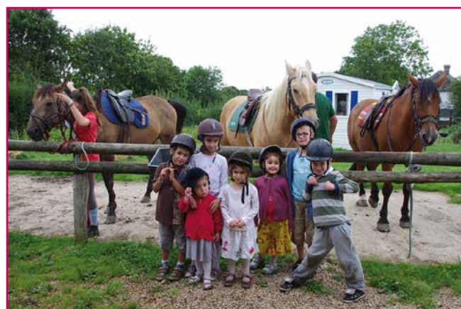
«A cheval pour la première fois»

Les chiffres de l'Office de tourisme l'indiquent, la saison 2014 reste une bonne année touristique malgré une légère baisse, attribuée à la météo incertaine du mois d'août. Les touristes étrangers sont de retour sur le territoire, après quelques années d'absence. Au camping municipal, on note de très bons chiffres pour le mois de juillet et un week-end affiché complet à l'occasion des Jeux équestres mondiaux au Haras du Pin. Les animations de l'Office de tourisme (visites de ville, journées à thème...) ont quant à elles attiré du public, avec en moyenne une trentaine de personnes présentes.