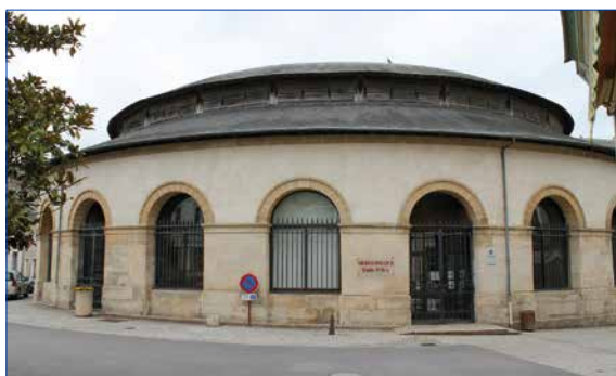
anciennes halles / médiathèque Emile Zola