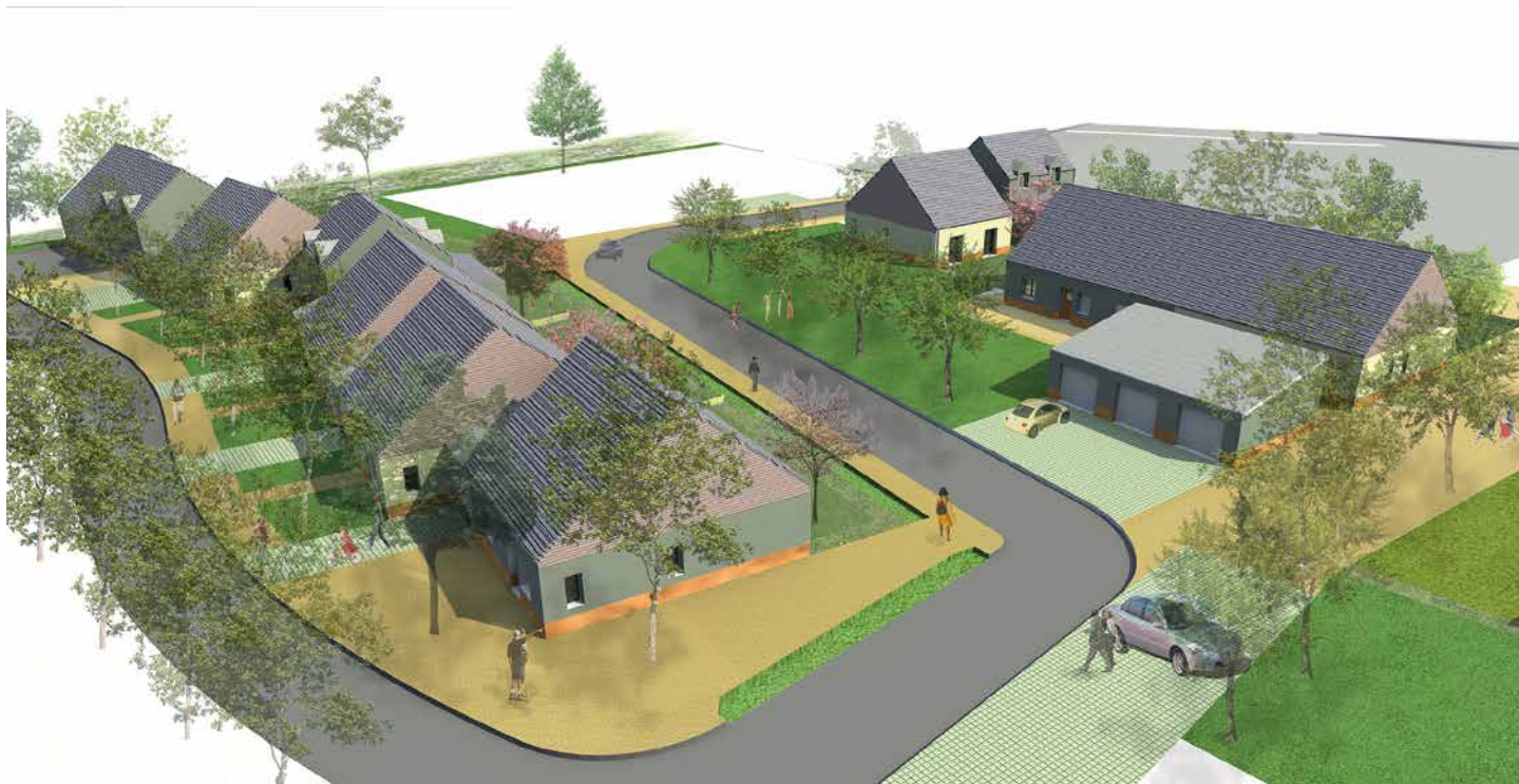
Vue générale du projet des 12 logements