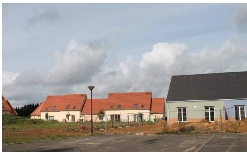
Vue actuelle de la place