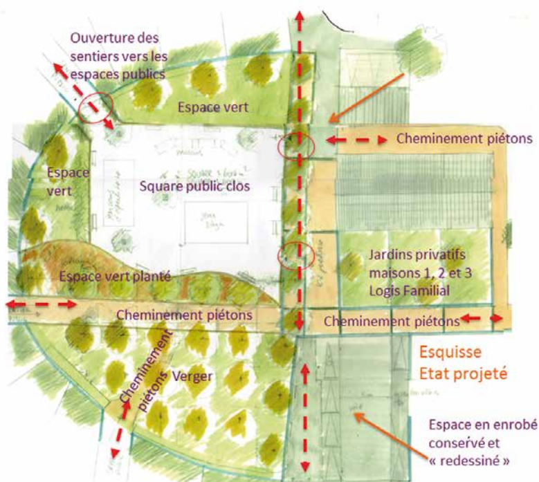
Projet d'aménagement de la place

Enfin, des chemins piétonniers en enrobé (accessibles aux véhicules de secours) assureront une circulation douce.