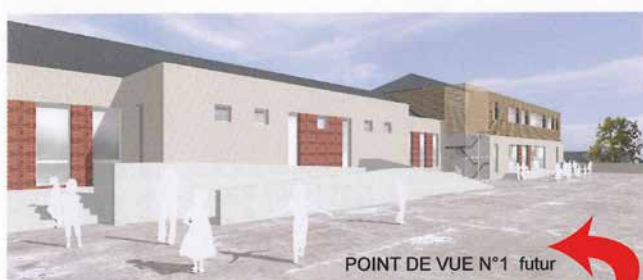
POINT DE VUE N°1 futur