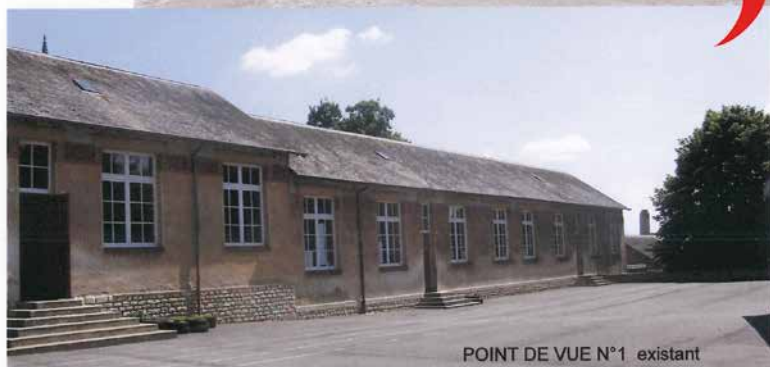
POINT DE VUE N°1 existant