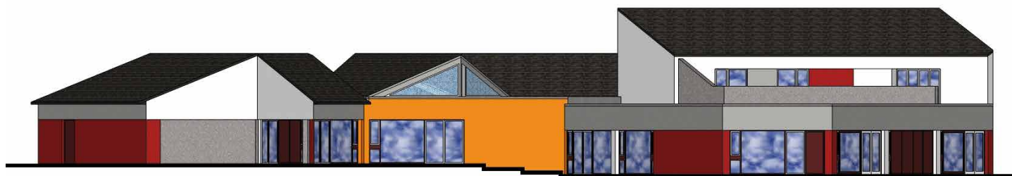
Vue générale du projet de La Lavanderie