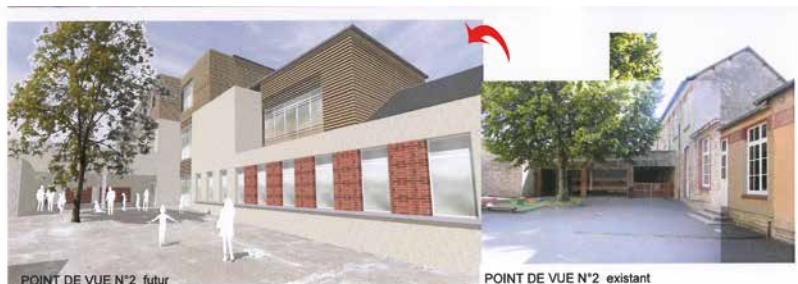
POINT DE VUE N°2 futur