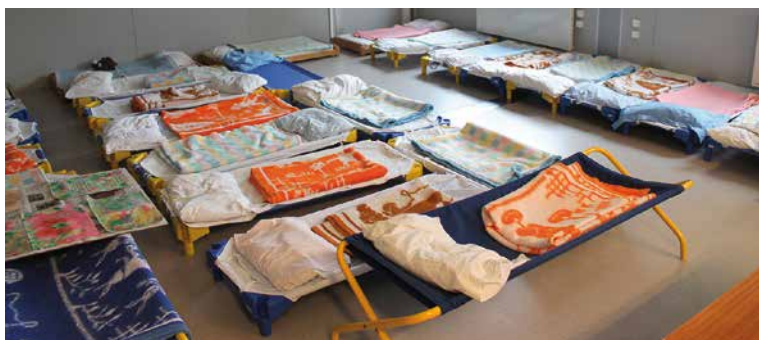
De haut en bas : classe de CE1/CE2 (annexe Forton) - classe des tout-petits (annexe Forton) - vue générale (école provisoire La Lavanderie) - réfectoire au centre polyvalent (école provisoire La Lavanderie) - dortoir (école provisoire La Lavanderie).

Ce n'est que le début d'une aventure qui nous mène vers une école plus confortable, adaptée aux exigences de notre époque.