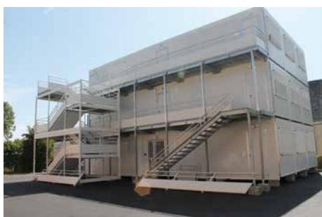
Structure d'accueil sur le parking de la CdC