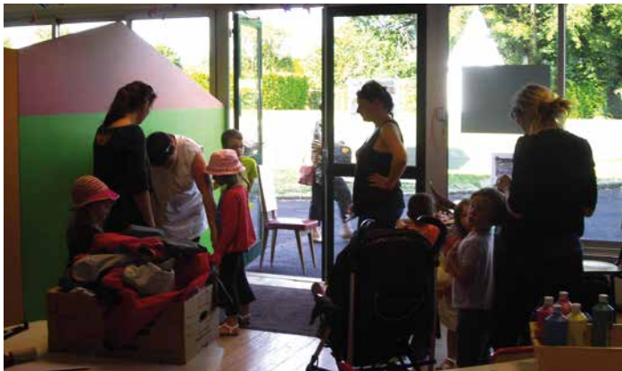
Arrivée avec Maman. Début d'une bonne journée remplie d'activités.