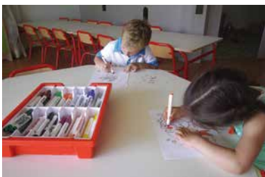
Coloriage sur la feuille ou sur la table, chacun son choix.