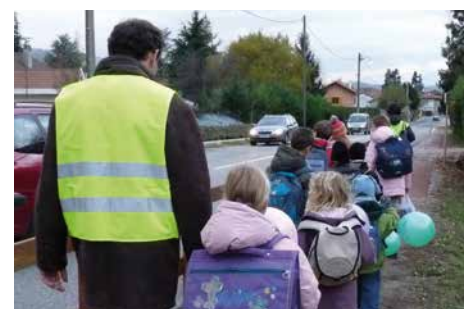
Exemple de pédibus (visuel d'illustration)