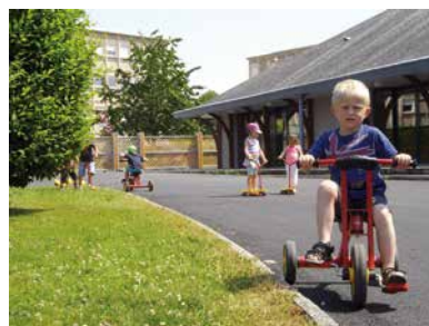
C'est parti pour les 24 heures vélo de Sées !