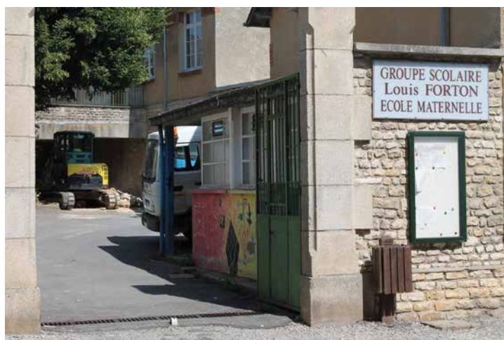
Les engins ont investi la cour fin août

L'école annexe (locaux provisoires) sera située à côté de la CdC des Sources de l'Orne, rue Auguste Loutreuil. Pour les élèves de l'école maternelle, les entrées, sorties et garderies auront lieu sur ce site. Pour les élèves de l'école élémentaire scolarisés à l'annexe, les entrées : 8 h.15 et 13 h.15 auront lieu rue Charles Forget. Les sorties : 11 h.30 et 16 h.30 auront lieu à la grille de l'école annexe.