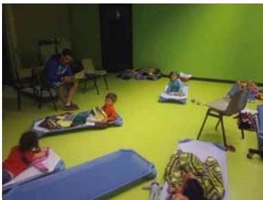
Le moment tant redouté de la sieste...