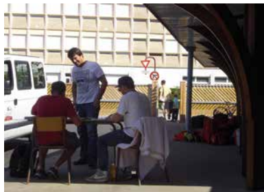
Départ du soir avec Papa, sous l'oeil vigilant du Président.