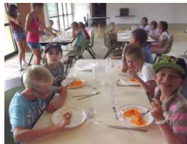
Repas du midi. Pas sûr que les carottes plaisent à tous !