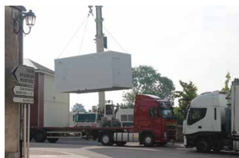
Arrivée des classes mobiles