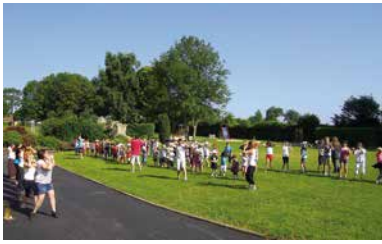
Fil rouge du centre : la chorégraphie réalisée sur « Pedida Perfeita ». Certains semblent dissipés.