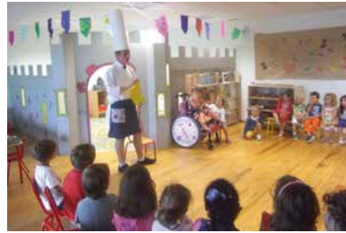
Mise en place d'un jeu avec les petits. Avez-vous déjà rencontré un cuisinier en short ?