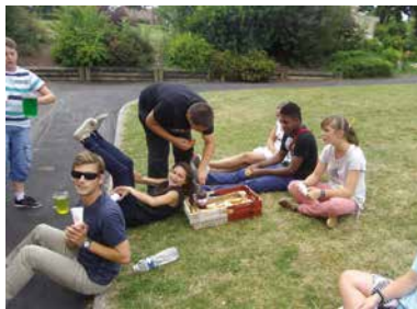
Pause bien méritée.