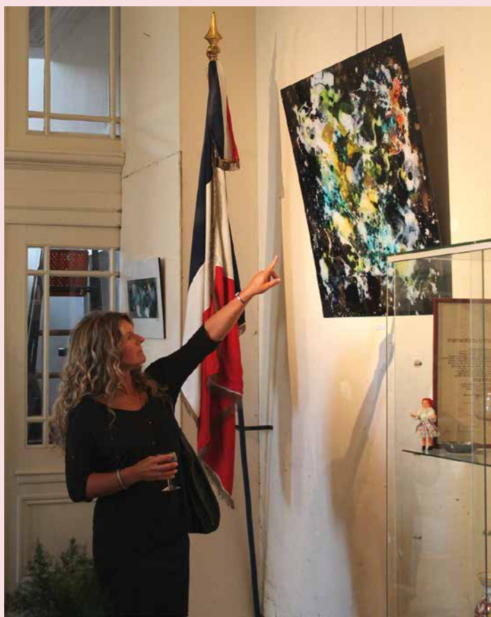
Question du public lors du vernissage.

Depuis le 10 août, les huiles sur verre de l'artiste Érékosé sont à découvrir dans le hall de l'Hôtel de ville et à l'Office de Tourisme. Le temps, son mouvement et l'emprise qu'il a sur l'être humain... autant de questions que cet artiste actif depuis plus de vingt ans a souhaité retranscrire de façon esthétique à travers une approche semi-figurative. En effet, certains détails ne sont pas sans rappeler des pièces d'horlogerie. Son souhait est avant tout d'amener le public à réfléchir sur la complexité de l'existence, représentée par la multitude des couleurs, des formes et des déplacements. A voir jusqu'au 31 octobre 2013.