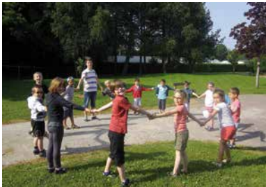
Soleil = jeux en extérieur.