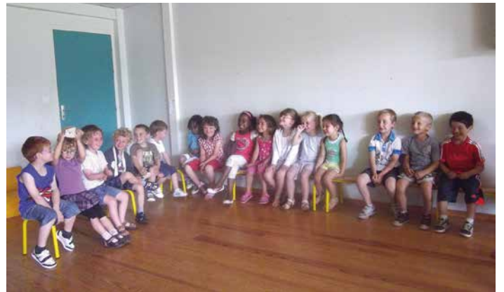
Première étape : l'appel.