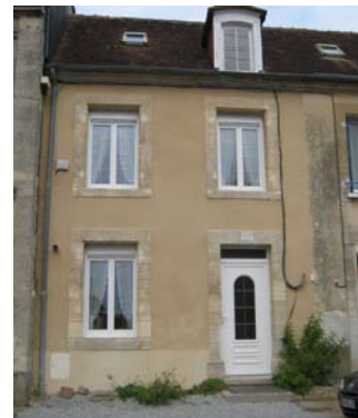
Exemple de ravalement de façade ayant bénéficié d'une aide de la mairie

Depuis plusieurs années, la ville de Sées attribue des subventions en faveur de la restauration des façades, en lien avec la politique du 1% Paysage & Développement.