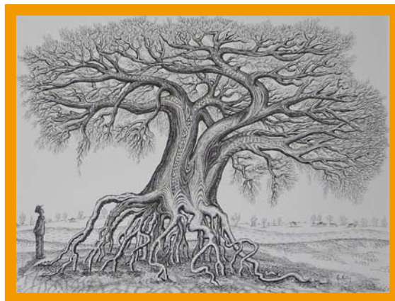
L'arbre de nos ancêtres, G. Ratier