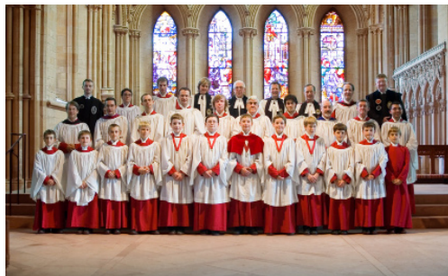
Choeur de Southwell Minster