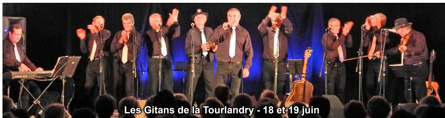
Les Gitans de la Tourlandry - 18 et 19 juin