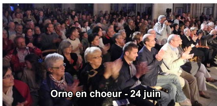
Orne en chœur - 24 juin