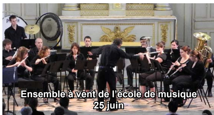
Ensemble à vent de l'école de musique 25 juin