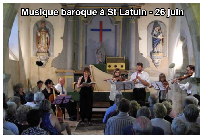
Musique baroque à St Latuin - 26 juin