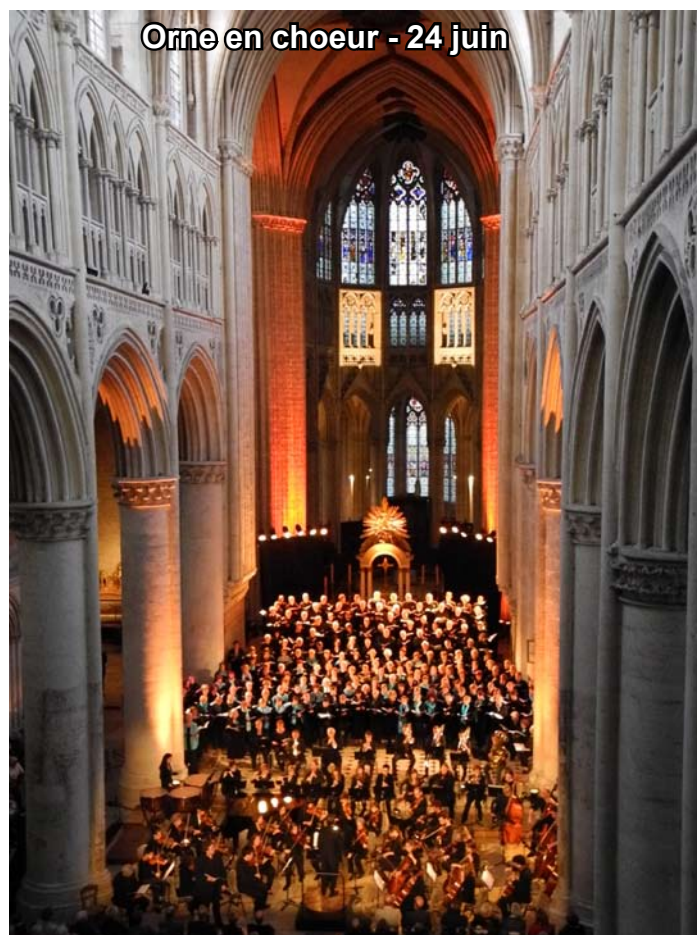
Orne en chœur - 24 juin