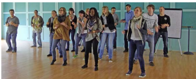
L'équipe d'animateurs au cours de la journée de préparation de l'été

Pour nous joindre : Centre de loisirs – Centre polyvalent – Rue du 11 novembre – 61500 SEES 02 33 28 17 25 ou 06 46 05 14 20