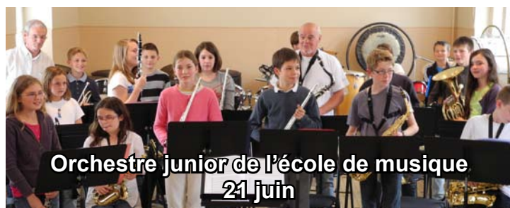
Orchestre junior de l'école de musique 21 juin