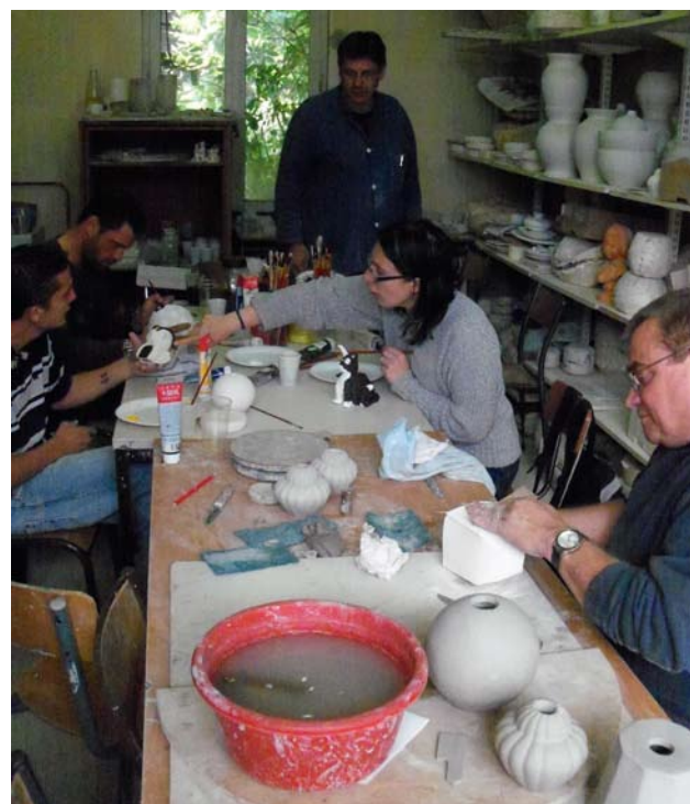
Les stagiaires ont été initiés à sept métiers : taille de pierre, vitrail, calligraphie, menuiserie, maçonnerie et corderie, sculpture, faïence. Il ne s'agissait pas de formation mais plutôt de découverte, aussi toutes les journées n'étaient pas consacrées au chantier : démarches, informatique, remise à niveau, insertion sociale, théâtre, dessin... rythmaient aussi les semaines