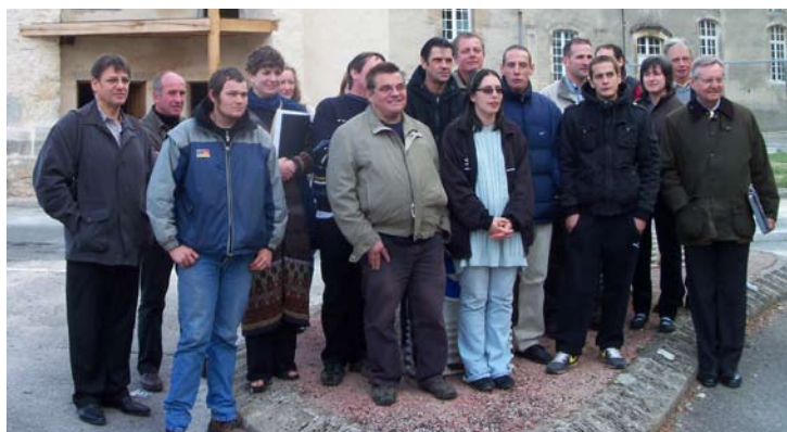
Groupe des stagiaires, formateurs et artisans le 14 octobre lors du bilan de l'action. Les stagiaires ont particulièrement apprécié leur participation à la fête du 4 juillet et aux journées du patrimoine. Leur formation s'est trouvée valorisée par leurs démonstrations professionnelles et l'intérêt du public.

Ces vingt-quatre personnes, loin de l'emploi, ont eu la chance d'être encadrées par des hommes de l'art et de découvrir des métiers valorisants en tenant compte de leur environnement. Le livret-souvenir de leur aventure a été très bien accueilli par les commerçants de la ville, avec lesquels ils ont été heureux de dialoguer. Certains ont trouvé dans ces quatre mois une vocation : l'une en calligraphie, l'autre en sculpture sur pierre, le troisième en maçonnerie. Tous sont fiers d'avoir participé au patrimoine de leur ville.