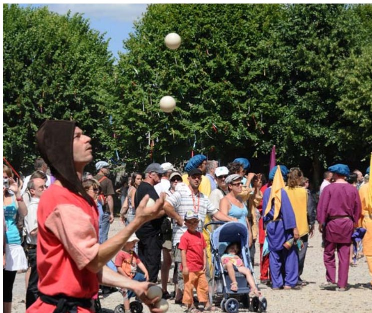
Fête du 4 juillet 2010 pour les 700 ans de la cathédrale

Possibilité de visiter l'exploitation et de suivre la traite à partir de 16h.