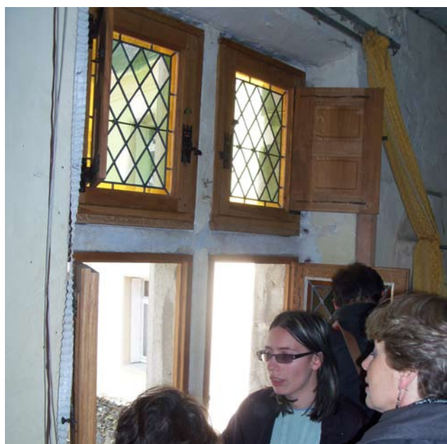
Explications autour de la fenêtre à meneaux du logis d'Argentré : les châssis en chêne, les volets intérieurs, les vitraux, la ferronnerie, la pose.... Les quatre verrières de la fenêtre ont été refaites dans l'esprit du XVème, en attendant une restauration totale du bâtiment par le Conseil Général en 2011. Les artisans ont travaillé en concertation avec l'architecte chargé de l'étude préalable du Palais d'Argentré et avec le service Patrimoine du Conseil Général. Les surmonts (pierres d'étanchéité des pignons) ont été taillés par les stagiaires, un fleuron a été sculpté. Ces pièces seront posées lors de la restauration sous maîtrise d'ouvrage du Conseil Général.