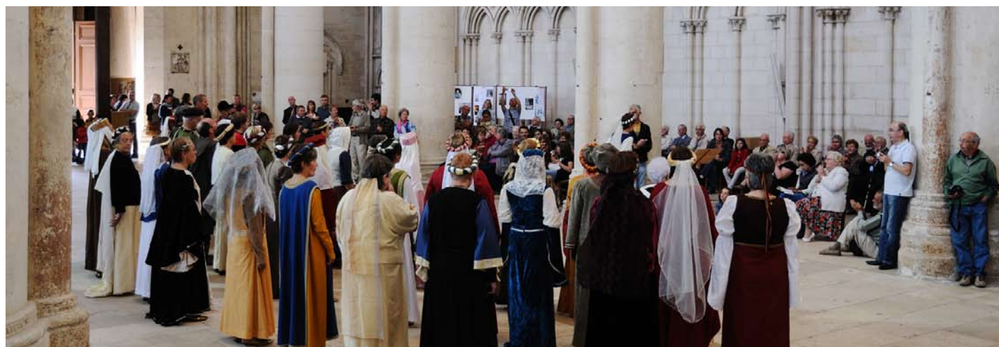
Les choristes d'Arpador, dans leurs magnifiques costumes médiévaux, ont occupé la nef vide comme au Moyen-Age