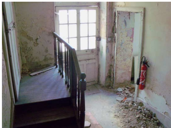
Des locaux vétustes, parfois insalubres, qui n'ont connu aucune amélioration depuis la désaffectation du collège en 1968. Pas de chauffage, un seul sanitaire pour une surface développée de 1200 m 2 , des fenêtres fixées par des planches, des plafonds qui s'effondrent.