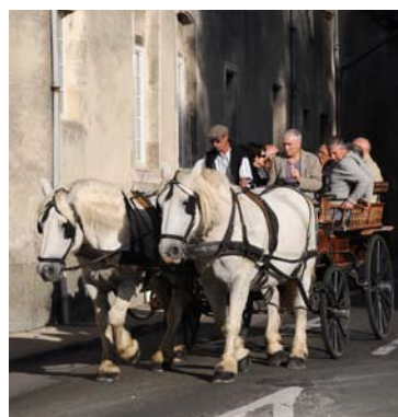
La carriole de Paul Godefroy