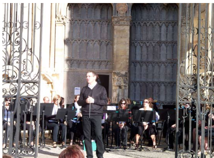
L'Alliance musicale a bravé le soleil sur l'esplanade