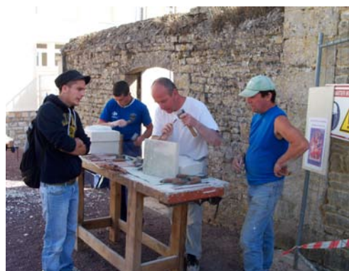
Atelier sculpture du chantier du Greta