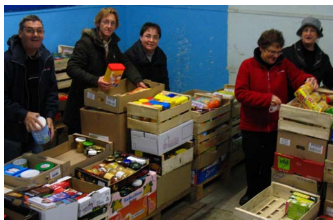
La collecte annuelle de la Banque Alimentaire des 27 et 28 novembre a permis de rassembler 2,4 tonnes de denrées. 53 bénévoles ont participé au tri, à la pesée, au ramassage et à la collecte dans les quatre magasins de grande distribution de Sées.