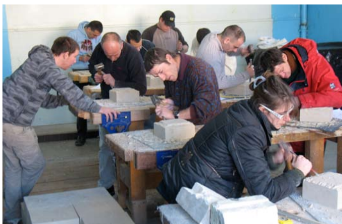
Les stagiaires du chantier poursuivent leurs ateliers. Ils ont exposé leurs premiers travaux de sculpture sur pierre dans la crèche de la cathédrale qui a pour thème les bâtisseurs. Après la menuiserie, la faïence et le modelage, le croquis et la photo, ils vont découvrir le vitrail, la taille de pierre et la maçonnerie en janvier.