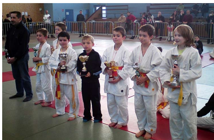
Le dimanche 6 décembre 2009, 180 judokas de 4 à 15 ans issus de 14 clubs ornais se sont retrouvés à Sées pour un tournoi entre Alençon, Sées, Argentan et Courtomer. La journée s'est passée dans la bonne humeur et le respect de l'adversaire.