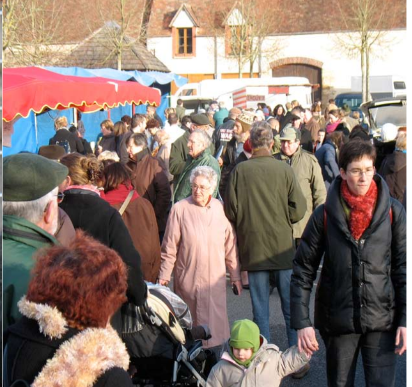
Foire aux dindes 2009