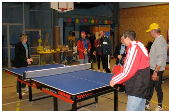
Tournois des trois raquettes, tour du canton en vélo, démonstration de maréchalerie, chansons du groupe des petits Cruisers, thé dansant, concours de belote et de manille, la mobilisation était maximale pour le téléthon 2009 à Sées.