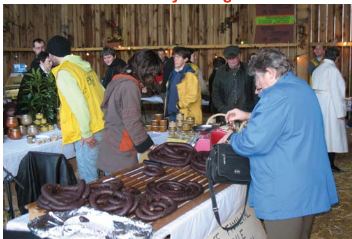
Il s'est tenu sous la pluie et le vent, comme il se doit pour un 21 novembre, mais avec une bonne humeur et une fréquentation qui n'ont rien à envier à certaines manifestations ensoleillées.