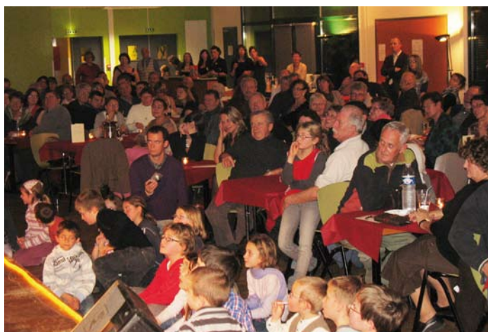
Un succès qui ne s'est pas démenti depuis la première édition en 2008 : les 250 convives réunis au centre polyvalent ont été autant séduits par le jazz que par la magie.