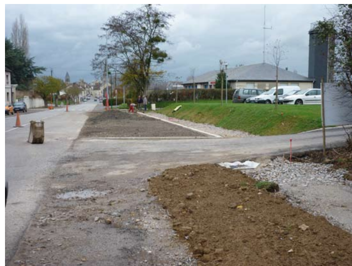
Avenue du 8 mai : le chemin piétonnier en préparation.

. Une étude a été lancée pour la restauration/reconstruction de l'ensemble Louis Forton afin de rationaliser l'espace des deux écoles, maternelle et primaire, et d'anticiper le coût des travaux dans l'hypothèse où il faudrait compléter les constructions sur site. L'étude est étendue à l'école maternelle La Lavanderie pour ce qui concerne les toitures, l'isolation et les menuiseries.