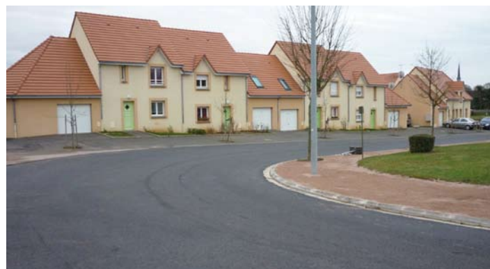
Les travaux de réfection de la Sente aux Bœufs et de la rue du Grand Séminaire viennent de se terminer.

Assainissement Non Collectif : Le contrôle des installations d'assainissement individuel (toutes les maisons qui ne sont pas reliées à la station d'épuration) est désormais de la compétence de la CDC, depuis le 15 septembre 2009, avec le Service Public d'Assainissement non collectif (SPANC)