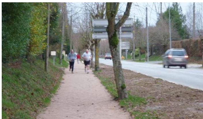
Travaux récents : le chemin piétonnier rue Loutreuil

En Janvier 2002, répondant à une volonté partagée de créer une Communauté de Communes unique, forte et efficace, les communes de la CDC du Pays d'Ecouves (Belfonds, Le Bouillon, La Chapelle-près-Sées, La Ferrière-Béchet, Tanville, Saint-Hilaire-la-Gérard et Saint-Gervais-du-Perron) adhèrent à la CDC du Pays de Sées qui réunit ainsi aujourd'hui toutes les communes du canton, Chailloué excepté.