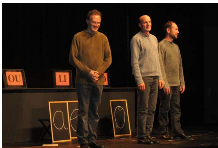
On a failli refuser du monde, la salle était bondée pour une prestation époustouflante du Théâtre de l'éveil autour des textes truffés de jeux de mots qui ont fait rire petits et grands.