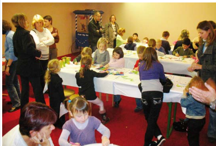
Chaque mois, le cinéma organise un mercredi avec projection, activités et goûter. Le 28 octobre, record de participation autour de Pirouette-Chansonnette , un film d'animation pour les plus petits.