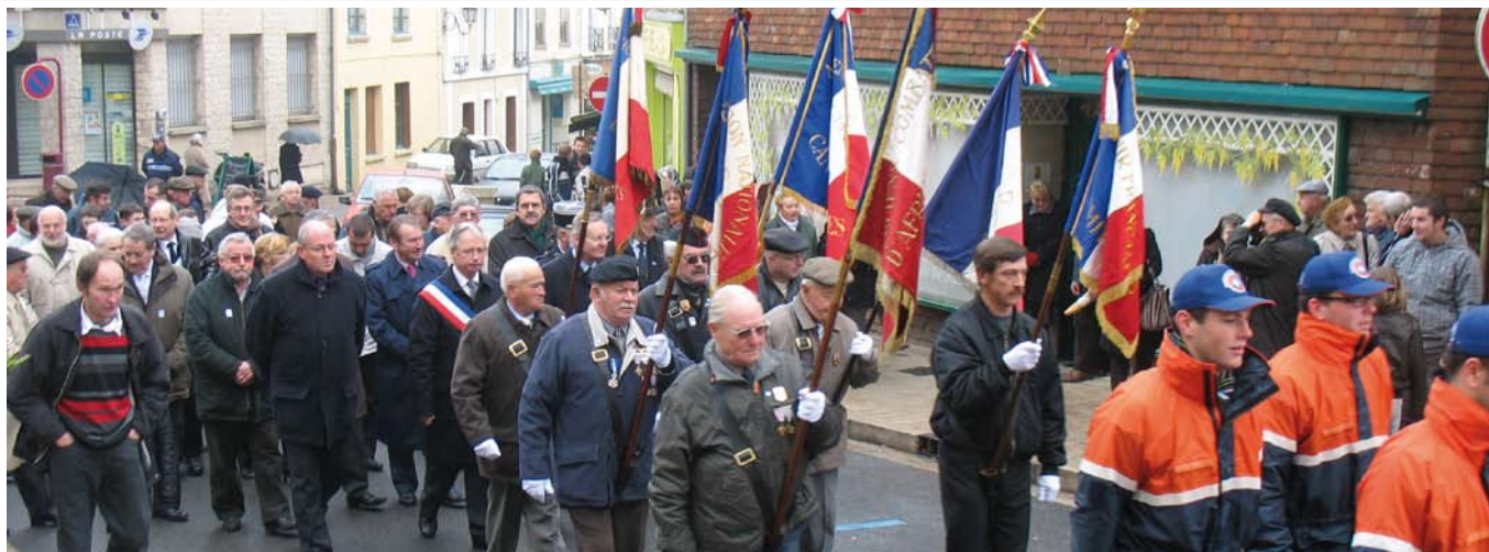
Cérémonie du 11 novembre : le défilé pour commémorer l'armistice de la guerre 14-18 a réuni de nombreux Sagiens.