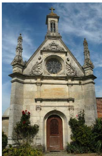
Chapelle Saint Joseph des Champs